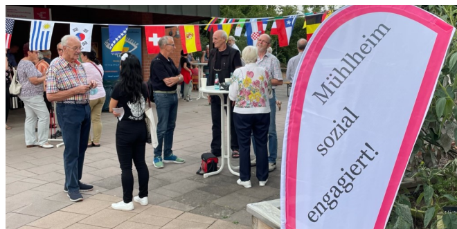
Café International des Freundeskreises am Fr. 09.09.2022, ab 15:30 Uhr

Unter dem Motto „Wir bauen Brücken“ hat der Freundeskreis der Mühlheimer Flüchtlinge das Café International als zentraler Treffpunkt für Geflüchtete und Freiwillige in Mühlheim etabliert. Sie sind herzlich eingeladen bei einem Getränk und Stück Kuchen zu verweilen. (Entfällt bei Starkregen oder Gewitter). Ort: Rathaus-Innenhof, Friedensstraße 20.