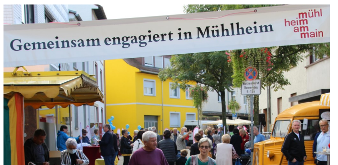
Straße des Ehrenamts am Do. 15.09.2022, ab 10:00 Uhr

Ort: Wochenmarktgelände auf der Bahnhofstraße.